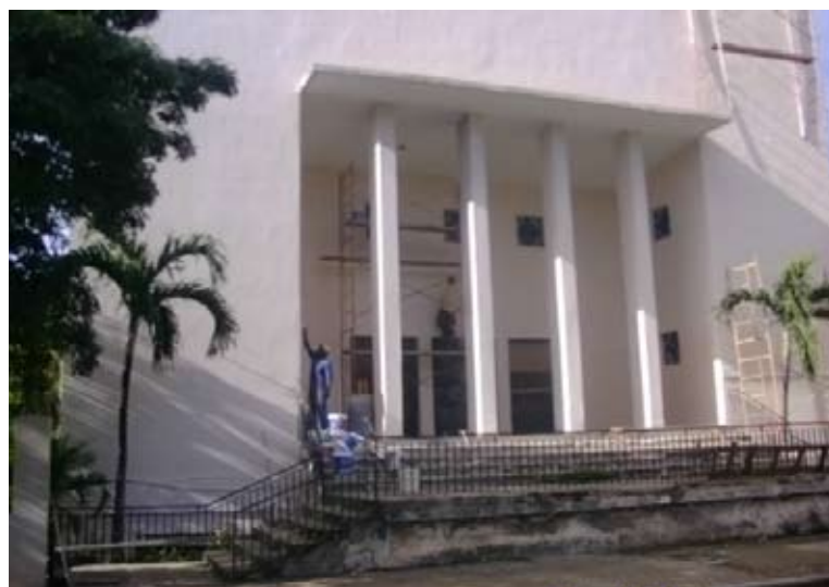
Реконструкция входа в сефардского еврейского центра в Гаване.