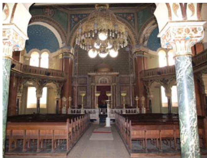
Интерьер главной синагоги в Софии

Болгарский совет еврейских женщин (CJWB)