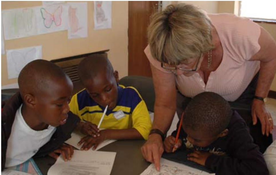
Волонтеры из Союза еврейских женщин в Дурбане, Южная Африка, ведущая чтения истории, сессии доступной один раз в месяц в школе Катона Крест в Квазулу Натал, в которой они также предоставили оборудование.

В докладах Национального совета еврейских женщин Канады , отмечено что состав их членов стабильный, но молодые члены предпочитают одноразовые проекты, а не регулярные встречи. Здесь тоже становится все труднее найти лидеров региональных отделений, так NCJW изменил свою организационную структуру, чтобы разделить ответственность между президентами, совместно с активными членами, которые не приходят на заседания совета директоров, а также других членов, которые участвуют только с одной из Функцией их секций.