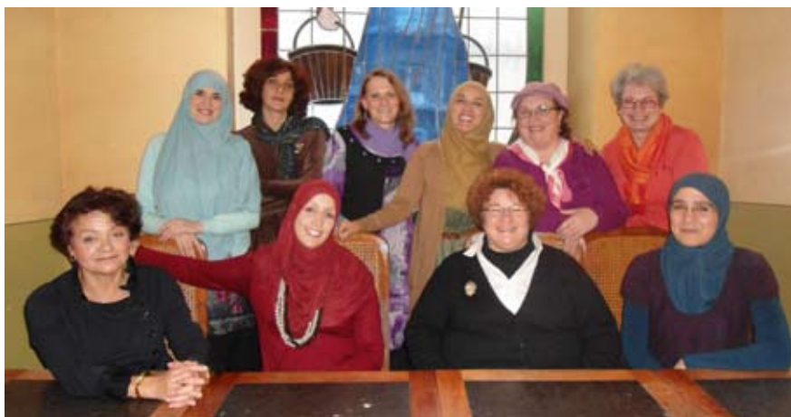
Мусульманские и еврейские участницы двойниковых выходных в Брюсселе в ноябре 2011 года.