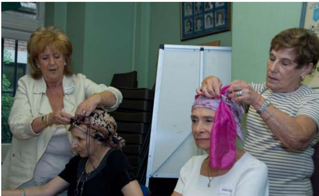
Члены британской лиги еврейских женщин "Headstart", команда добровольцев проекта поезд -Путь вперед, помогают женщинам, которые потеряли свои волосы во время лечения, чтобы связать платки и придать им привлекательный стиль.