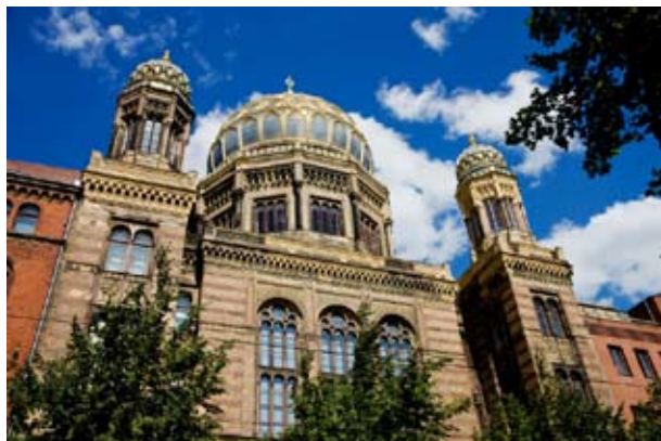
Отремонтированная Новая синагога в Берлине

чем было отказано на протяжении многих десятилетий в коммунистическую эпоху.