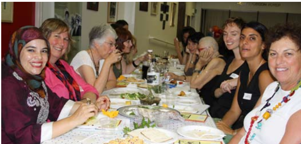
модель Межконфессионального женского седера в Мельбурне, Австралия

возможность испытать радость и традиции Песаха, ознакомиться с традиционной едой. На Национальной конференции NCJWA состоявшейся в 2011 году, межконфессиональной встречи, состоящей для