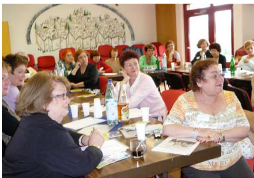
Еврейские женщины из филиалов JFB слушают лекцию на ежегодном национальном семинаре.

После 1990 года, когда объединенная Германия открыла свои границы для евреев из бывшего Советского Союза, JFB пережил второе возрождение. Хедва