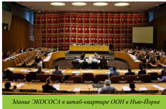
Здание ЭКОСОСа в штаб-квартире ООН в Нью-Йорке

в их решении. Сюда относятся борьба за права женщин, повышение их статуса в обществе, необходимость положить конец жестокости, насилию и торговле женщинами. В круг этих проблем входит также и здоровье женщин и охрана окружающей среды. Наша задача заключается в том, чтобы голос еврейских женщин был услышан на заседаниях различных комитетов ООН. Кроме того, мы должны информировать о дискуссиях в ООН наши филиалы в различных странах мира, используя нашу вебсайт. Эти отчеты должны также направляться в адрес Исполкома и всех филиалов.