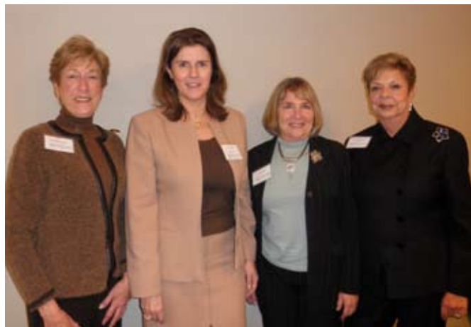
Мадлен Брехер, Президент ЭКОСОС Х.Е. Сильвие Лукас, Джоэн Лурье Гольдберг и Фрэн Бутенски на ланче женщин-послов в ходе работы 54-й Конференции по Статусу Женщин

Главными событиями календаря ООН, посвященными женщинам, являются двухнедельные сессии Комиссии ООН по Статусу Женщин ( www.ngocsw.org ), собирающиеся ежегодно в марте (см. стр. 22-23). Представители МСЕЖ участвуют в работе Исполкома Неправительственного Комитета по Статусу Женщин в Нью-Йорке. Этот комитет является форумом для обсуждения и обмена информацией по важным вопросам и программам