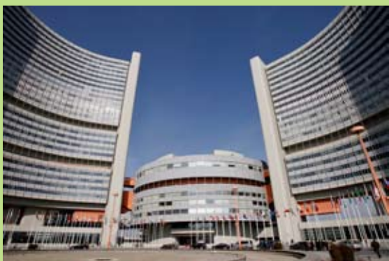
Комплекс учреждений ООН в Женеве

“Наша основная цель –участвовать в заседаниях Совета по Правам Человека, который главным образом критикует Израиль. Недавно мы участвовали в 48-й сессии Комитета по Прекращению Дискриминации Женщин(КПДЖ). Этот комитет обсуждал ситуацию в Израиле. Но вместо того чтобы обсуждать положение женщин в Израиле, основное внимание экспертов было сосредоточено на судьбе палестинских женщин в условиях Израильской оккупации.”