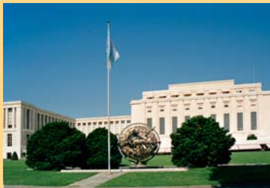
Комплекс зданий отделения ООН в Вене

3. Неправительственный Комитет по Проблемам Старения является аналогом Нью-Йоркского комитета. В 2010 он отметил Международный День Пожилых Людей. Кроме того, он организовал дискуссию о значении для этой возрастной группы сформулированных ООН Целей Развития в Новом Тысячелетии.