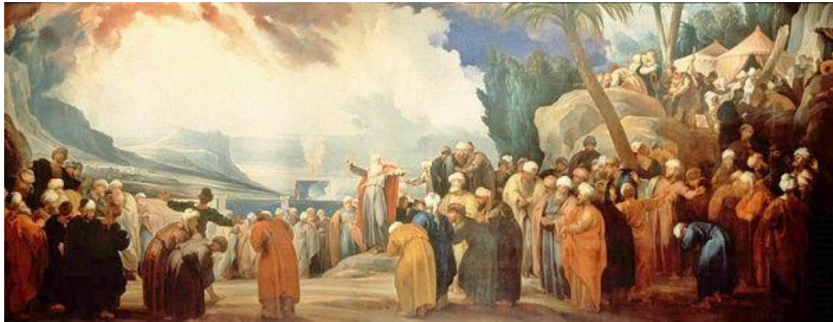
Moisés selecciona a los 70 ancianos - Jacob de Wit (1695–1754)

Y apareció el Eterno en la nube y habló con él; y tomó del espíritu que estaba en él y lo puso en los setenta ancianos, y fue así como posó sobre ellos el espíritu, y profetizaron aquel día y después nunca más. Pero se habían quedado dos de aquellos hombres en el campamento, siendo el nombre de uno Eldad, y el nombre del segundo Medad; y posó sobre ellos el espíritu, pues fueron contados entre los inscritos pero no habían ido a la tienda, y ellos profetizaron en el campamento. ( Números 11:25-26 )