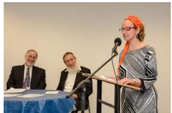
La ordenación de la autora como rabina en 2015

Mientras que un rey hereda la autoridad que se transmite de generación en generación y se impone por la fuerza, nuestras instituciones democráticas obtiene su legitimidad del consentimiento de los gobernados. Las personas tienen el derecho de aceptar la autoridad que escojan, tal como queda reflejado en el modelo de Débora. Basado en este modelo, algunos rabinos permiten ordenar mujeres rabinas ortodoxas y aceptan diversos tipos de liderazgo femenino.