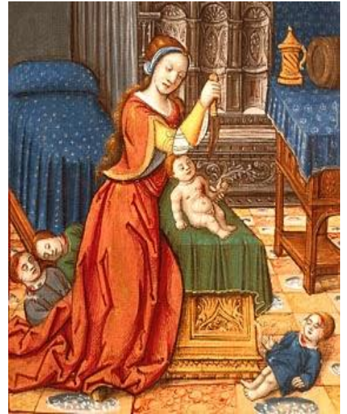
Atalíah por Antoine Dufour

mandó a los jefes de centenas que gobernaban el ejército, y les dijo: Sacadla fuera del recinto del templo, y al que la siguiere, matadlo a espada. Porque el sacerdote dijo que no la matasen en el templo del Señor. Le abrieron, pues, paso; y en el camino por donde entran los de a caballo a la casa del rey, allí la mataron.