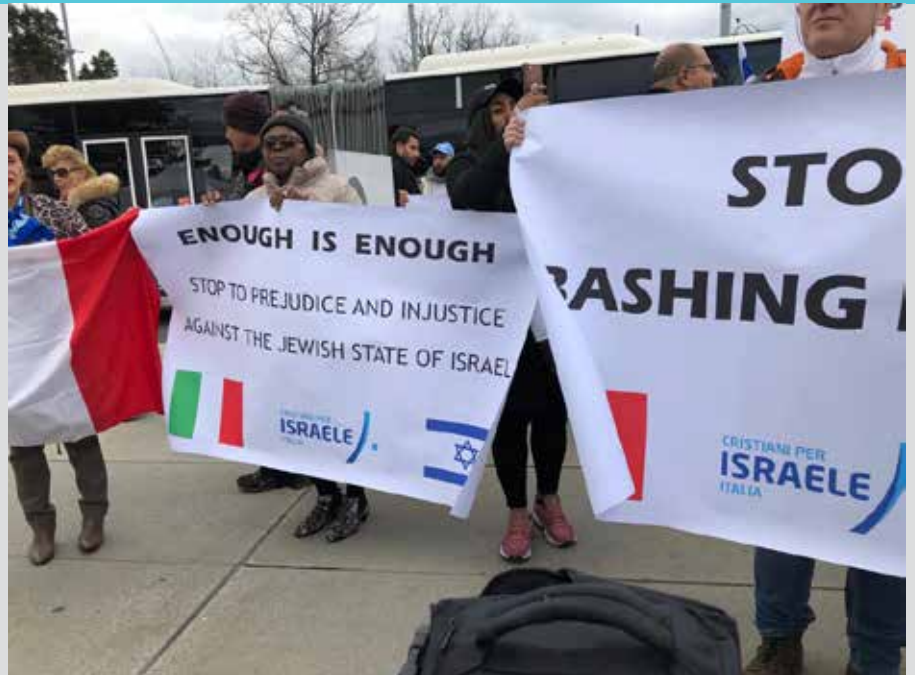
Демонстрация за равные права перед штаб-квартирой Организации Объединенных Наций в Женеве, март 2019 г

В 2008 году к моему удивлению, произошли положительные сдвиги: Израиль стали называть по имени, а не «сионистское образование», арабские делегаты призывали к «решению проблем двух государств», а Восточный Иерусалим провозглашался столицей Палестины вместо «Иерусалим, вечная столица палестинского народа».