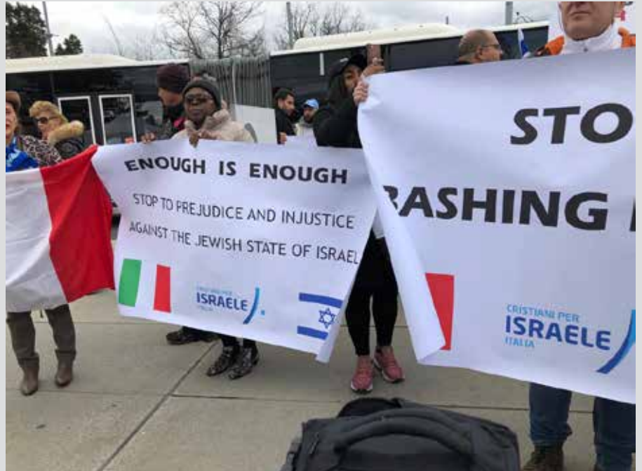
Manifestación por los Derechos Igualitarios frente a la sede de las Naciones Unidas en Ginebra, marzo 2019

llamado por su nombre y no como “la Entidad Sionista” los delegados árabes exhortaban a una solución de dos estados, con Jerusalén como la capital de Palestina, en vez de mencionar a “Jerusalén como la capital eterna del pueblo palestino”.