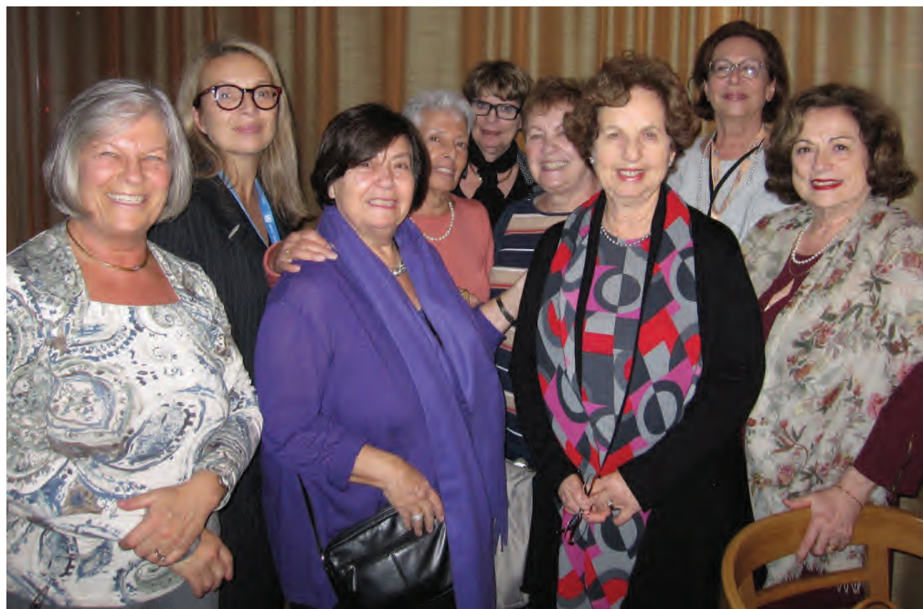
Delegadas del CIMJ al 20° Foro de ONG de la Comisión Económica y Social de las NNUU en Ginebra, nov. 2014

El hecho que Israel sea un tema permanente en la agenda internacional, implica que la organización debe actuar con ecuanimidad para defender la existencia de Israel y criticar o no las acciones de su gobierno. Para las organizaciones internacionales con sede en Israel, tal el caso de WIZO, es mucho más difícil mantener su política de lealtad total tomando en consideración el creciente descontento de muchos de sus miembros con esta política.