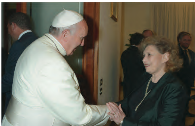
El Papa Francisco y Sara Winkowski

El diálogo inter-religioso es un tema prioritario para el CIMJ. Fortalecer nuestra relación con personas de otra fe solo puede tener resultados positivos para nuestra organización, y para todas las comunidades judías. Hay muchas formas de hacerlo, y exhortamos a todas nuestras filiales a buscar los medios para relacionarse con personas de otras confesiones, especialmente mujeres.