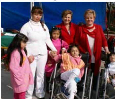
VJM представляет инвалидные коляски для детей с особыми потребностями

Добровольцы из VJM работают в двух центрах пожилых граждан, учебных классах пения, чтения, ремесел и физических упражнений, а также ведут сессий групповой динамики и эмоциональной терапии. Еще одним важным ежегодным проектом является сбор свитеров и шарфов для пожертвования нуждающимся людям, которые живут в горах.