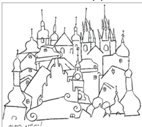
ССЖВ Логотип