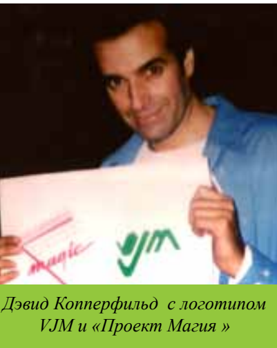
Дэвид Копперфильд с логотипом VJM и «Проект Магия»

Члены добровольцы VJM в Национальном институте педиатрии, помогают детям пациентам и их семьям. Они делают аналогичную поддержку работы в больнице общего профиля в Мексике и в больнице общего профиля Ньюкаптан, посещая различных подопечных и предлагает терапевтическую помощь. Они пытаются предоставить одежду, игрушки, медицинское оборудование и мебель в случае необходимости. Они также работают вместе с мексиканским Красным Крестом, по сбору средств и обеспечению одеждой и обувью для пациентов, которые выписаны из больницы. Это партнерство было активизировано в течение последних 40 лет, и женщины из VJM также помогли им в течении ряда национальных и местных стихийных бедствий.